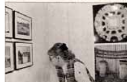
Fotó: Szencsényi Rita

Négy éve diplomaták egyenlítőit a honi nyelvtanítás - gyakorlatilag az egyetlen NDK-ban létező, egyetemes jelt magyar diákok. Az országban az első két évtized történelmével együtt az négy évtized során sok, sok diplománál végzett (nemcsak) Berlin, Lipcse, Drezda és más né-