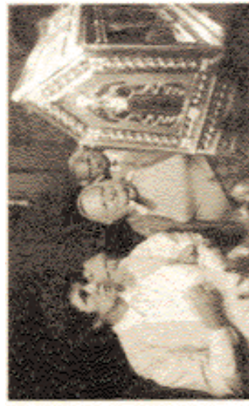
Boldog Gizella alakja az ereklyetartón, amelyben az első magyar királyné, Szent István hitvese karcsont lát őrizik. Az ereklye most került haza a németországi Passauból a királyné városába, Veszprémbe, ahol a szent jobbal együtt tízezer tekintették meg

A német lovagok, egyházi emberek és kézműves városrosteremők után különösen a Hahóburgok Ausztriában és a reformáció (Luther vá-